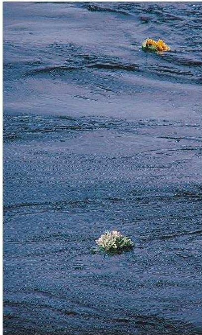
Blumengebinde erinnern an den schmerzlichen Verlust.